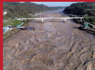
令和元年の大洪水を流す 大河津分水

昭和42年の羽越水害や、平成16年、平成23年の新潟福島豪雨災害をはじめ五泉でも水害が発生している。国内を見ると令和元年東日本台風災害の水害被害額が過去最大を記録するなど気象災害の激甚化が懸念されている。