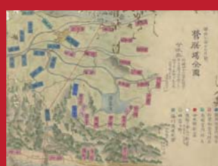
第1期工事の計画絵図

明治3年から行われた第1期大河津分水工事では、人力掘削のため遅々として工事が進まないことや、工事の地元負担金の重荷などが原因で、三条周辺でも様々な動きがありました。