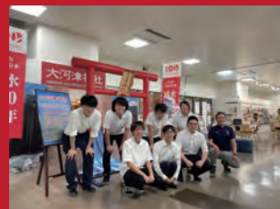
新潟経営大学の学生が作成した大河津神社

新潟経営大学の学生が考案し、実現した手作り神社。地域の方々と一緒に造り上げ、燕三条駅や道の駅等に建立しました。ご神体は大河津分水の川底で約100年にわたって洪水を流し続けた「通水石」。当日は特別に会場に展示する予定です。