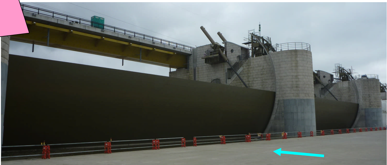
ゲートの試験を実施中。当日は、ゲートの動く様子をご覧いただけます。