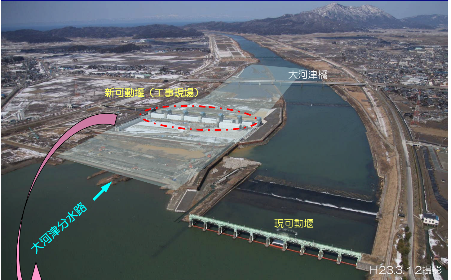
ゲートの試験を実施中（現可動堰上流側より望む）