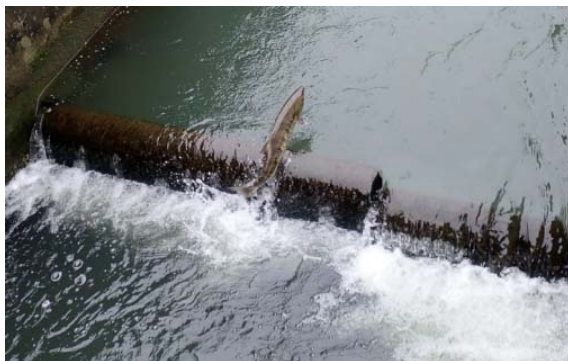
妙見堰の魚道を遡上するサケ