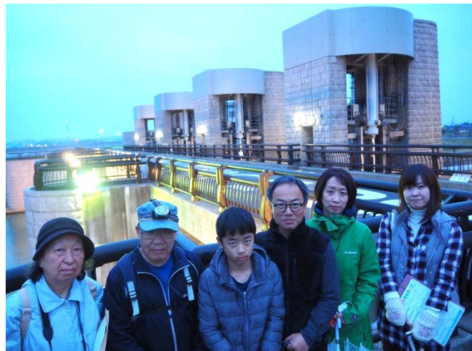
ライトアップされた洗堰を背に記念撮影しました。