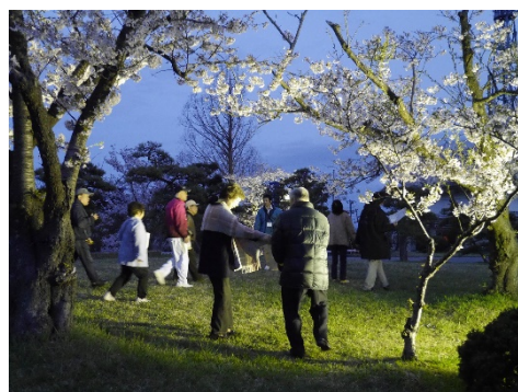
3000本の桜並木の歴史や桜名所100選に選ばれた由来などを聞き、大河津分水の歴史とともにライトアップされた夜桜を楽しみました。(4月13日)

燕三条まちあるきの1コースとして開催されました。最初に信濃川大河津資料館4階展望室にて概要を説明し、その後、屋外に繰り出し、石碑や夜桜、そして特別にライトアップされた洗堰を見学しました。参加者の皆さんにはクイズ用紙が渡され、大河津分水の謎を解きながら夕暮れの大河津分水を歩きました。