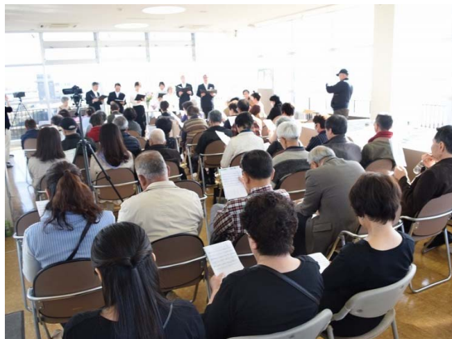
会場にお越しの皆さんと「信濃川補修工事の歌」を合唱しました。