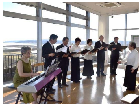
6名による合唱。大河津分水を背景に、力強く、雄大な歌声が館内に響き渡りました。