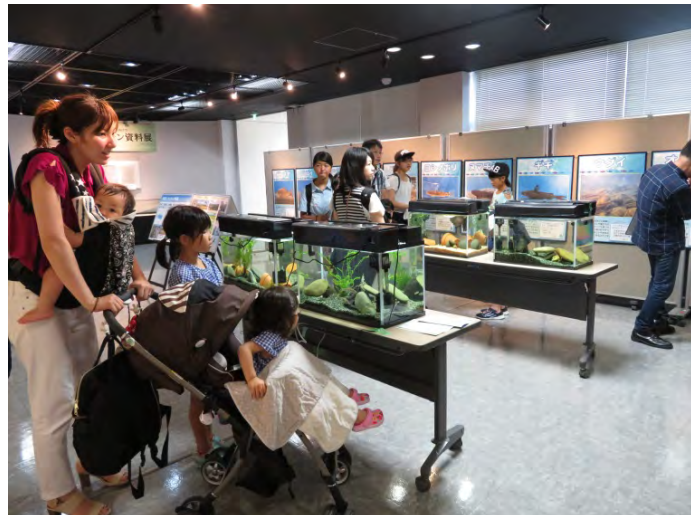
会場の信濃川大河津資料館2F。大勢の来館者で賑わいました。