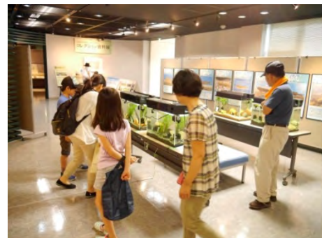
ご家族3代で楽しめるのも生き物の魅力です。帰省中のご家族も多くいらっしゃいました。