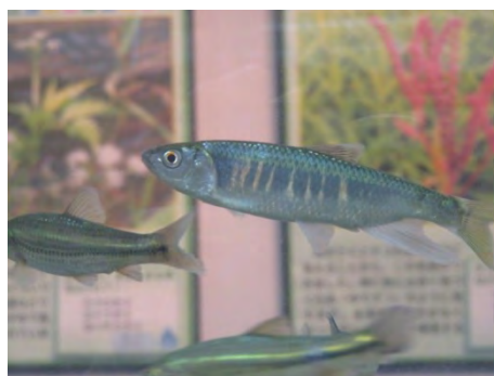
オイカワは、この時期は繁殖期で体の色が変化していました。