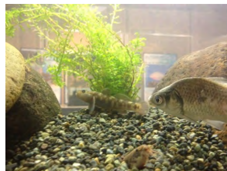
生き物展を知らずに偶然来館された方々も賑やかな水槽に足を止めて観察されていました。