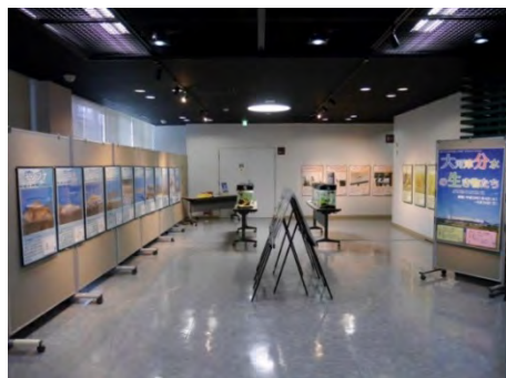
パネルや水槽で大河津分水の生き物たちの特徴や多様性を紹介しました。

大河津分水周辺で見られる魚に関するパネルを11枚、草花に関するパネルを4枚、野鳥に関するパネルを4枚設置したほか、大河津分水の河川環境の特徴なども紹介しました。また、大河津分水公園にて捕獲した魚を4台の水槽で紹介し、実際に目で見て生き物の大切さに触れていただきました。