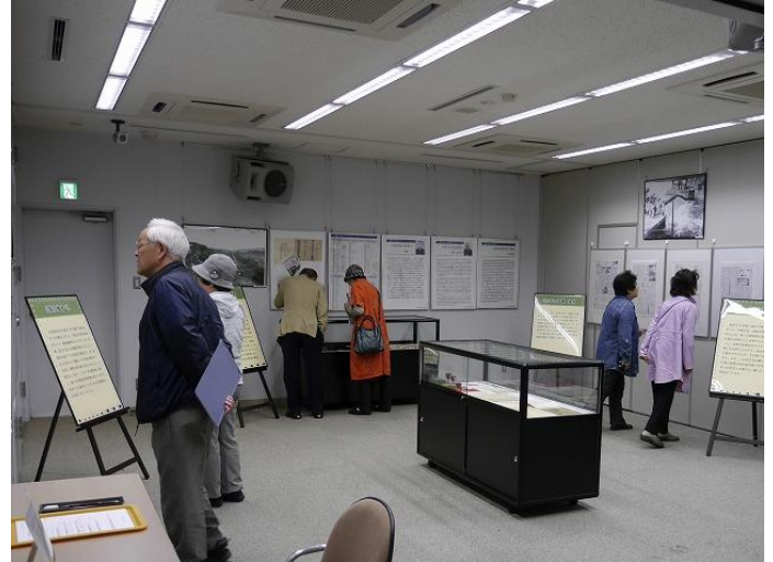
第2期工事の様子を物語る貴重な資料を多数展示しました。