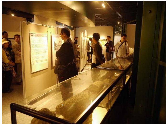
技術者の方や青山士に興味がある方も来館されました。