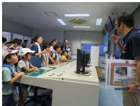
堰の操作室では、たくさんのボタンや大きな画面が並び、365日24時間休まず稼働していることを、みんな真剣に聞いていました。