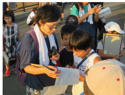
クイズはその場所に行って内容がわかるミッション形式でした。「問題は何だった?!」とみんなで一生けん命に答えてくれました。