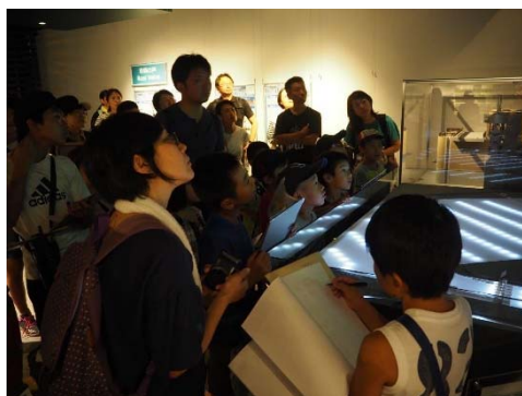
堰操作のしくみコーナーでは、堰の上下流で雨が降った場合の可動堰、洗堰の操作の違いを映像とともに学んでもらいました。

信濃川大河津資料館で大河津分水や堰の操作のしくみを学んだ後に、実際に可動堰や洗堰、堰の操作室を巡っていただきました。各施設を巡りながらクイズを出題し、ガイドの内容をもとにみんなで相談しながらワークシートに記入していききました。最後は堰カードと分水路スケールの記念品を贈呈し、楽しい夏の思い出に加えてもらいました。