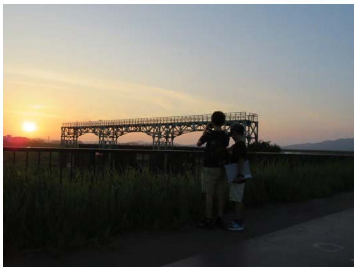
特別にライトアップされた洗堰や夕焼けに染まる旧可動堰も楽しみながら見学会を行いました。