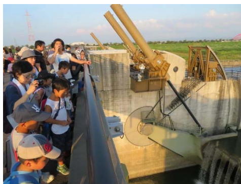
可動堰では、ゲートが動き出す瞬間に立ち会えることができ、「わー！すごーい！かっこいい！」の大歓声があがりました。