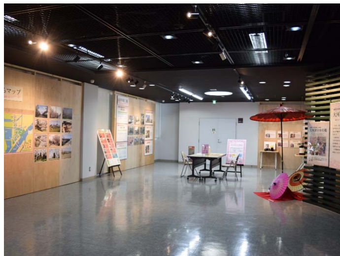
会場となった2階企画展示スペース。