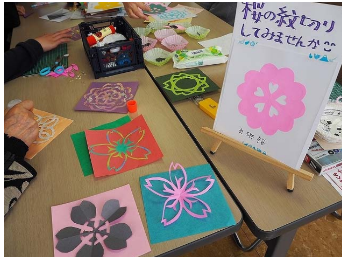
大河津分水の桜を眺めながらの体験となりました。