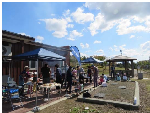
炭火でじっくり焼き上げるお肉。暖かいBBQストーブを家族で囲みました。

親子水辺キャンプが開催されました。空き缶やツナ缶など、身近な物を使って楽しむ防災ワークショップや、普段見慣れないアウトドア用品に触れ、水辺の楽しさを満喫できるイベントとなりました。また、テーマ「大河津分水にあったらいいもの」について参加者の皆さんから多くのアイデアが発表されました。