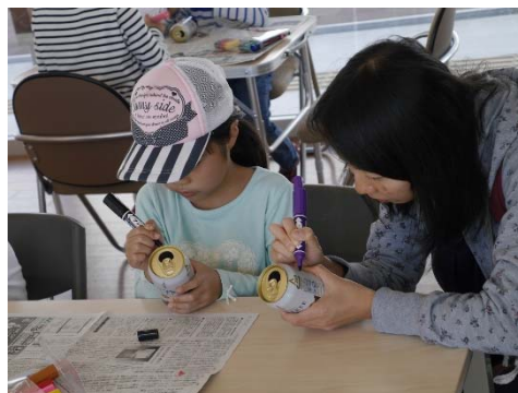
空き缶ランタン作りに挑戦です。賑やかだった会場が静かになり、集中してる様子でした。