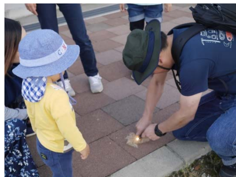
ファイヤースターターを使って、火おこし体験。ほぐした麻縄に火種を飛ばしました。