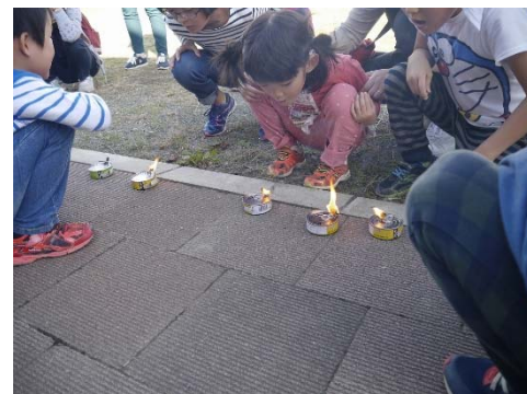
炎を上げるツナ缶ランプ。子ども達が吹き消そうとしてもなかなか消えませんでした。