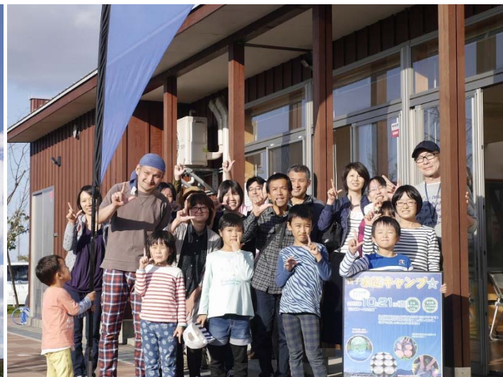
気温23度、爽やかな秋晴れのさくら公園に多くの参加者が集まりました。