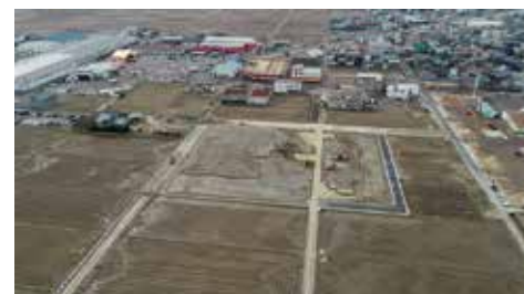
燕市 【保育園・浄水場整備事業の造成地(保育園敷地状況)】