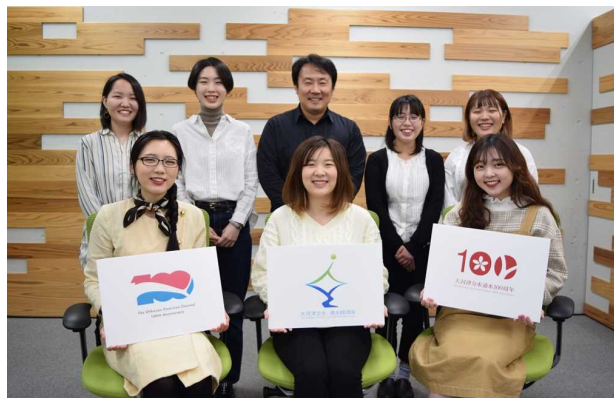
私たちがデザインしました！ （長岡造形大学 金助教と学生達）