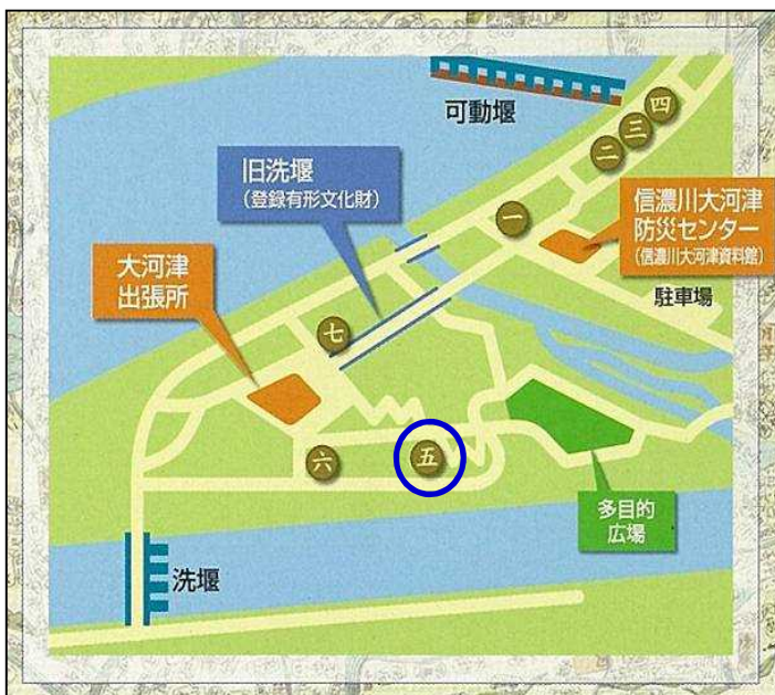
石碑・記念碑の位置図

大河津出張所の周辺には、慰霊碑の他にも大河津分水路工事に関わる石碑・記念碑があります。