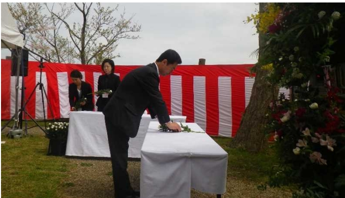
昨年度の実施状況

現在は、その後の信濃川補修工事及び大河津分水完工後の維持管理工事等を行う上で殉職された16名（昭和40年度が最終）の方を含め、100名の方のお名前が石碑に刻印されています。