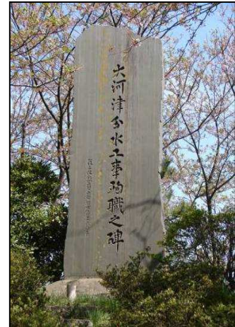
大河津分水路工事殉職之碑