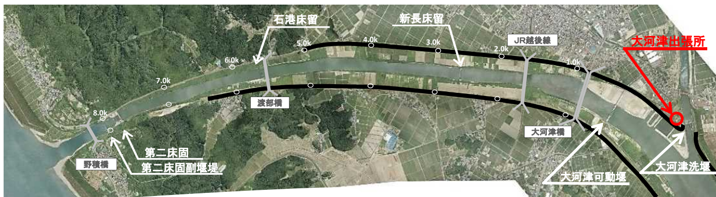
流下能力が不足し、抜本的な改修が必要な大河津分水路

主な出席予定者：地元選出の国会議員、県議会議員、市議会議員、新潟県知事、新潟市長、長岡市長、三条市長、燕市長