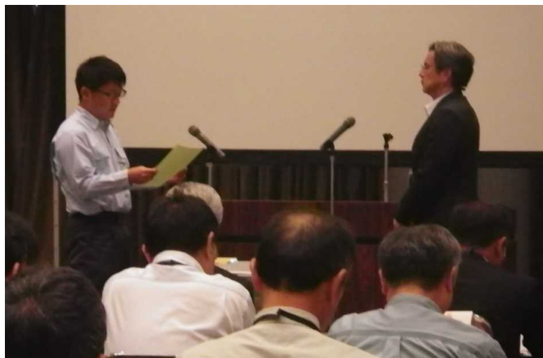
～ 昨年度 建設労働災害防止大会の様子 ～