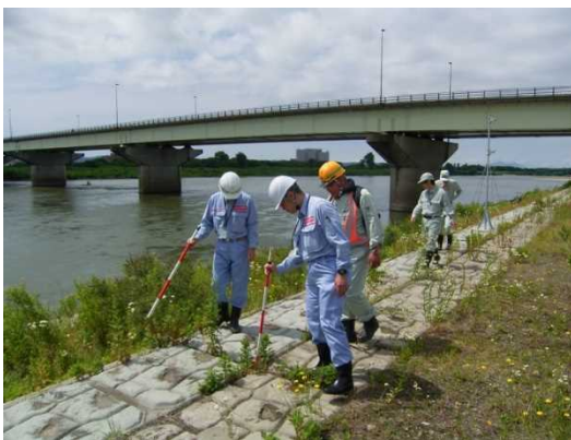
昨年度の点検状況 (長岡市大手大橋右岸)