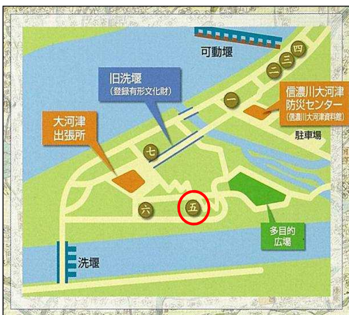
石碑・記念碑の位置図

大河津出張所の周辺には、慰霊碑の他にも大河津分水路工事に関わる石碑・記念碑があります。