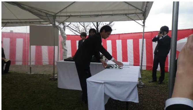
昨年度の実施状況

現在は、その後の信濃川補修工事及び大河津分水完工後の維持管理工事等を行う上で殉職された16名（昭和40年度が最終）の方を含め、100名の方のお名前が石碑に刻印されています。