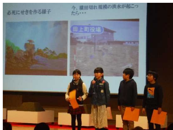
長岡市立寺泊小学校4年生