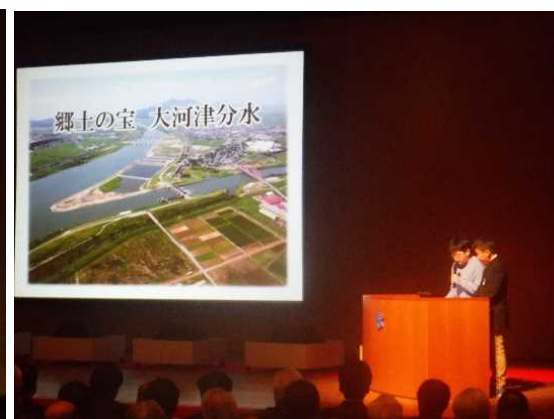
燕市立分水小学校5年生