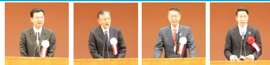
北陸地方整備局長 水管理・国土保全局長 新潟市長 新潟県知事