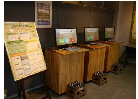
【クイズ端末設置状況(1Fホール)】