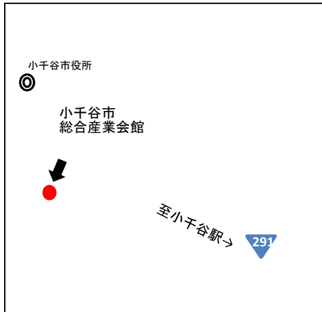
小千谷市総合産業会館サンプラザ