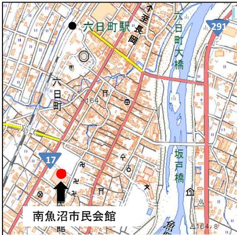
南魚沼市市民会館