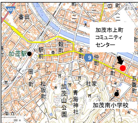
加茂市上町コミュニティセンター