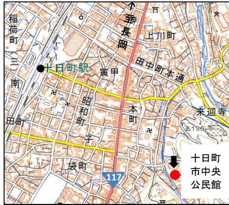
十日町市中央公民館