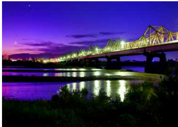
グランプリ(信濃川中流及び魚野川部門最優秀賞) 「大河の夜明け」