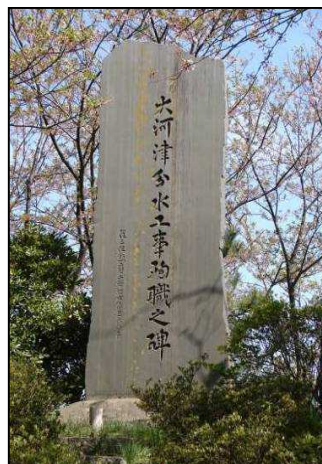
大河津分水路工事殉職之碑