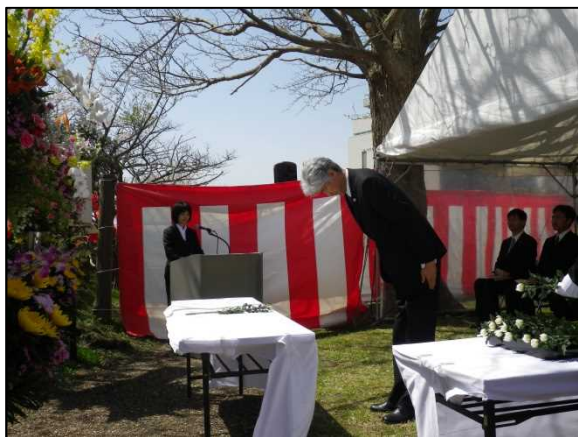
昨年度の実施状況

現在は、その後の信濃川補修工事及び大河津分水完工後の維持管理工事等を行う上で殉職された16名（昭和40年度が最終）の方を含め、100名の方のお名前が石碑に刻印されています。