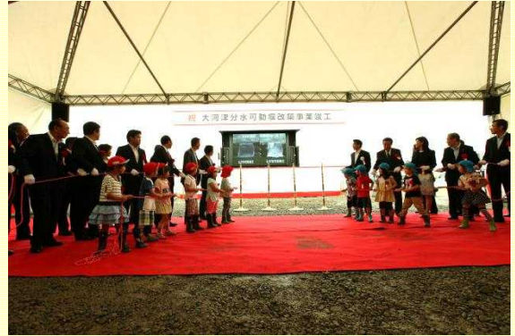
可動堰竣工式 親柱除幕の様子