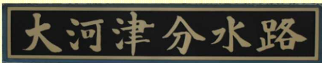
森長岡市長様 執筆 (左岸下流側)

親柱には、河川名及び堰名が書かれた銘板が取り付けられています。銘板は、地元の長岡、燕市長及び事業者代表として北陸地方整備局長、信濃川河川事務所長に執筆いただきました。