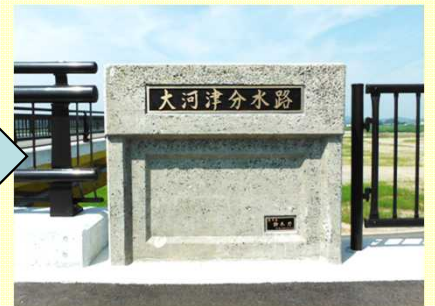
親柱として生まれ変わりました