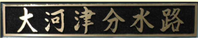
鈴木燕市長様 執筆 (右岸下流側)