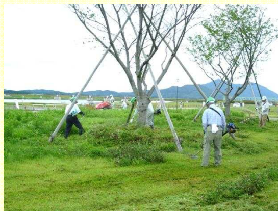
除草作業の様子（分水さくらを守る会）

なお、分水さくらを守る会では10月18日（土）に大河津分水路の桜並木の剪定やゴミ集積などの保全活動を実施されます。参加を希望される方は当日8時30分に大河津分水さくら公園にお集まりください。詳細は分水さくらを守る会（電話0256-97-2520）にお問合せください。