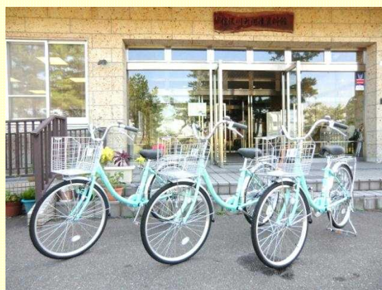
新たに導入されたレンタサイクル

一部通行のできない場所などもありますので、ご利用にあたっては、係員の説明を受けてください。