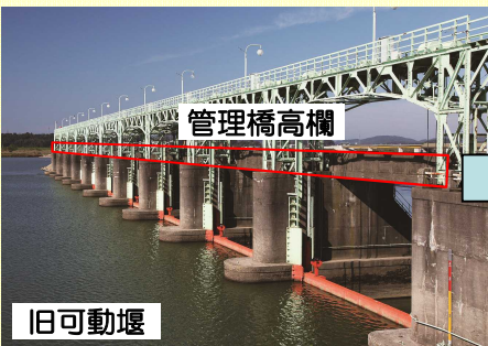
※第4～10径間の高欄を使用

約80年間、越後平野を洪水から守ってきた旧可動堰へ感謝を示すとともに旧可動堰同様に長い期間にわたり稼働できるようにとの願いを込めて、旧可動堰管理橋の高欄を利用して