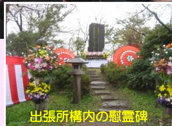
出張所構内の慰霊碑