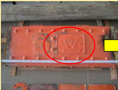
ゲート天端部の切断片