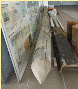
旧堰上流の水叩基礎部から採取した木杭（長さ6.5m）