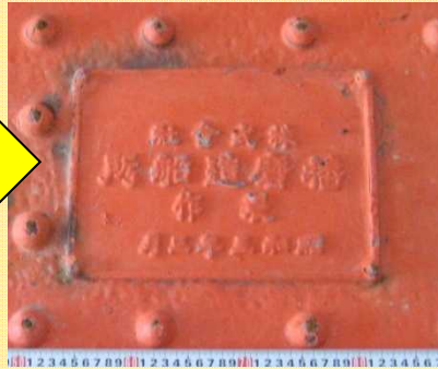
建設当時の製作会社の銘板