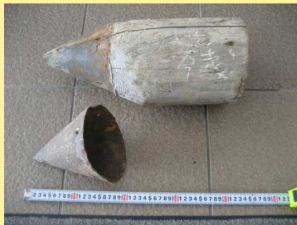
木杭の先端部。鋼板で補強されました。（写真は分解したもの）