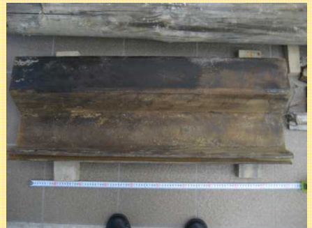
独製矢板の切断片