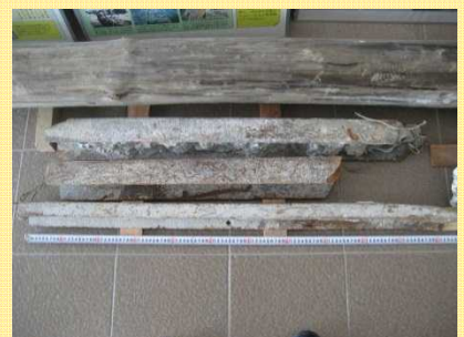
堰柱内には、補強用鋼材として軌条（レール）が設置されていました。

大河津可動堰情報館ホームページから、毎月1日には可動堰回覧板の最新号をご覧頂けます。また、バックナンバーも合わせてご覧頂けます。アドレスは「 http://www.hrr.mlit.go.jp/shinano/kadouzeki/ 」です。 『可動堰なんでも電話』を開設し、みなさんからのご意見・ご質問などをお待ちしております。 0258-32-3134（平日 AM9:00~PM4:00）