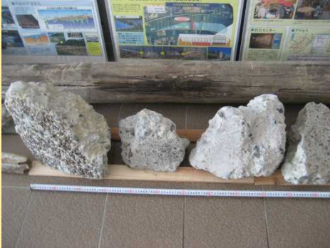
堰柱部のコンクリート片