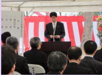
鈴木燕市長のご挨拶