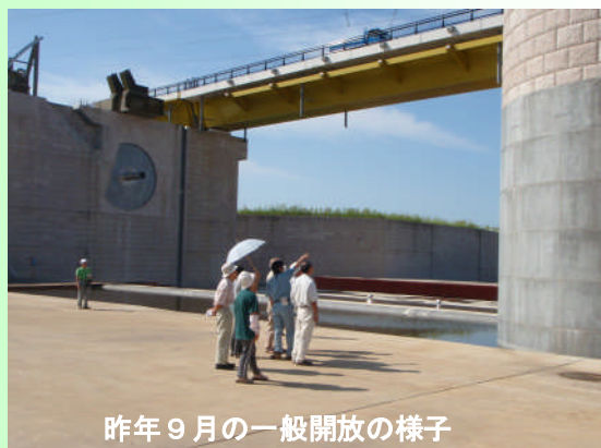
昨年9月の一般開放の様子