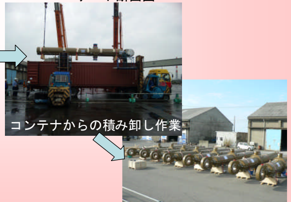
新潟西港での荷卸し状況