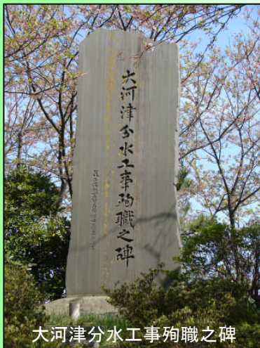
大河津分水工事殉職之碑

慰霊祭は、どなたでもご覧いただけます。（※座る場所などは、慰霊祭会場にて職員が案内をいたします。）なお、一般の方の献花は、式典終了後に献花台の脇に生花を用意しておりますので、ご自由に献花を行うことができます。（16日限り）