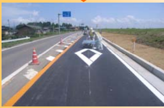
24時間体制で緊急復旧工事を実施し、10日間で堤防機能と道路機能を回復しました。写真は完成目前の区画線を設置しているところです。