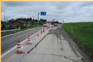
地震直後、堤防居住地側の県道長岡寺泊線に亀裂が入った様子。