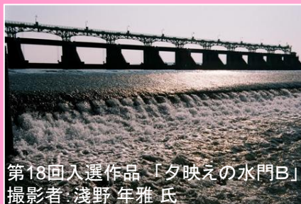
第18回入選作品「夕映えの水門B」 撮影者:浅野年雅氏

【ご自宅の近くの見慣れた風景など、あなたの見た「信濃川」を撮影した写真を募集します。初めての方も、お気軽にご応募下さい。】