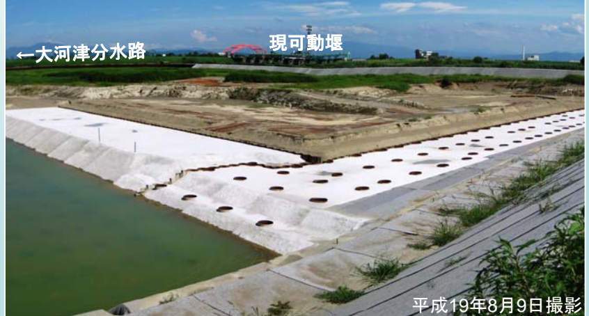
再開を待つ堰本体工事現場の状況

可動堰本体工事は、出水期のため現在は休止期間中です。堰本体工事は規模が大きく、必要な設備も大規模なものとなるため、出水期にも安全に工事を実施するためには、工事現場に大規模な仮締切堤などが必要となり、多額の費用がかかることなどから、7月から9月末までの出水期は工事休止期間としています。工事を再開する10月からは、いよいよ堰柱や魚道の建設が始まる予定です。