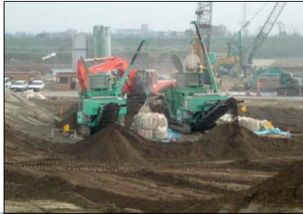
土質改良工 (この後、信濃川下流の堤防盛土材料などとして利用します)