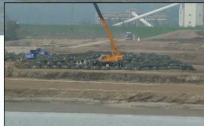
フィルターユニット作成 (仮締切工の前面保護用)