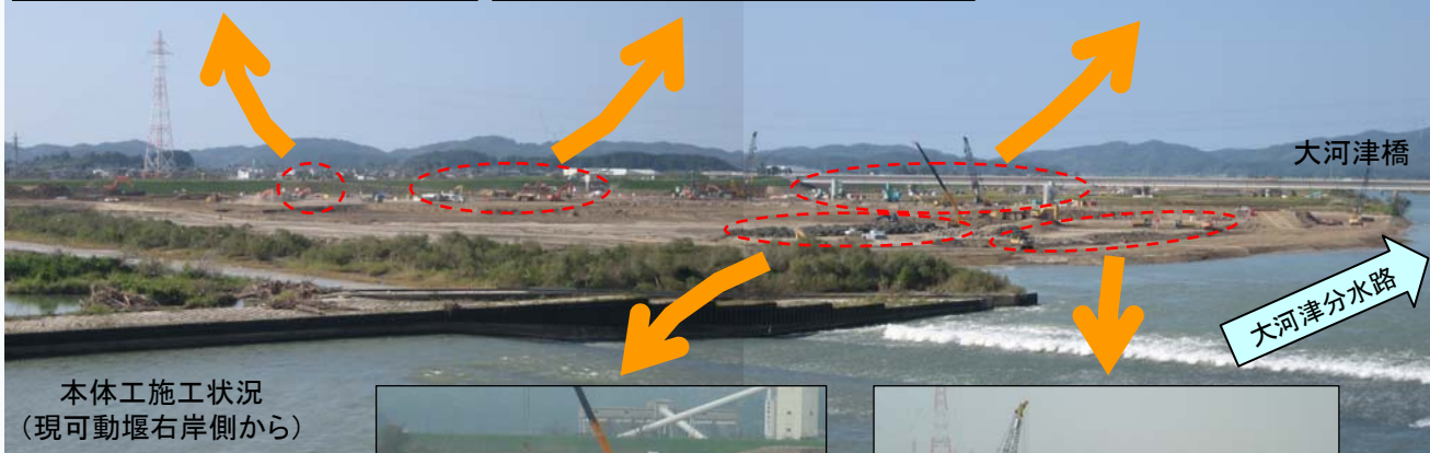
本体工施工状況 (現可動堰右岸側から)