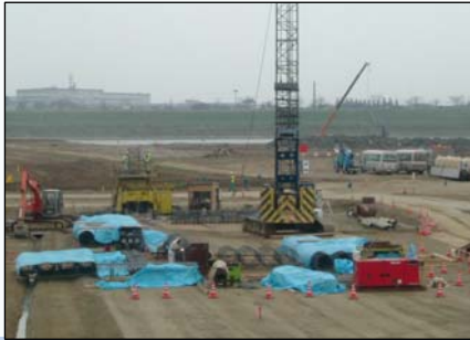
管理橋下部工の基礎工 (ブルーシートの下は基礎工の鉄筋など)