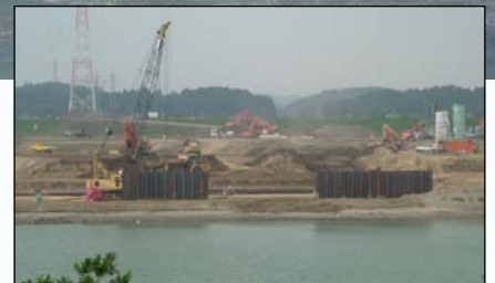
鋼矢板による仮締切工設置