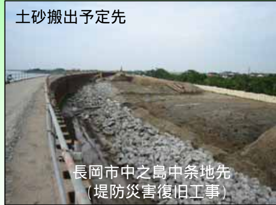
長岡市中之島中条地先 (堤防災害復旧工事)