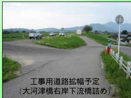
工事用道路拡幅予定 (大河津橋右岸下流橋詰め)

工事や河川に関することはなんでも大河津出張所へ Tel 0256-97-2121 (建設監督官在所) 大河津出張所 : 大河津分水全般に関する工事監督・維持管理等 建設監督官(可動堰改築担当) : 大河津可動堰改築事業に関する工事監督等