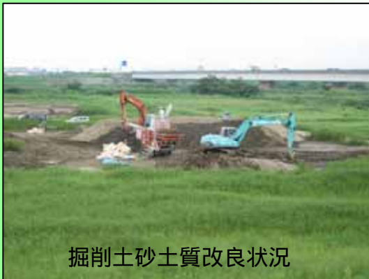
掘削土砂土質改良状況