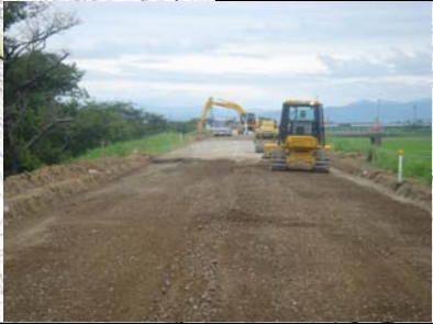
燕市野中才(下流)地先