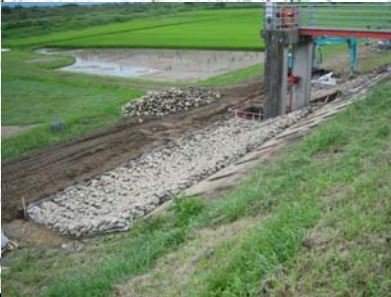
長岡市町軽井地先