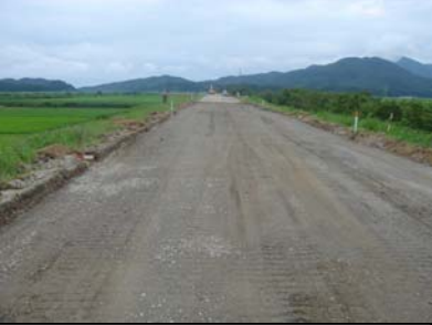
燕市野中才(下流)地先