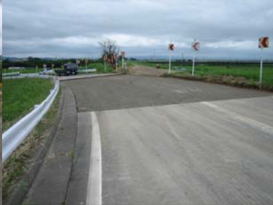
燕市野中才(上流)地先