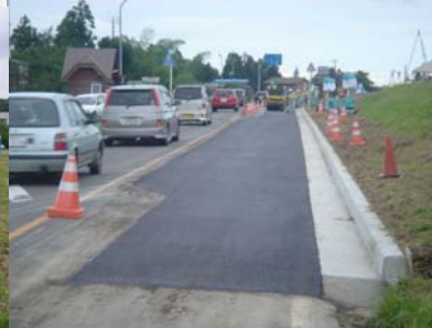
長岡市町軽井地先