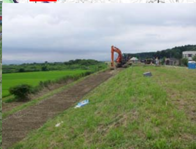
長岡市町軽井地先