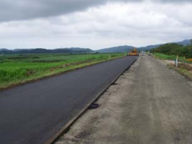
燕市野中才(上流)地先