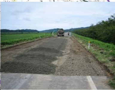
燕市野中才(上流)地先