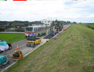
長岡市町軽井地先