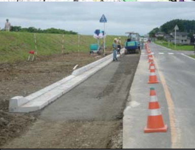
長岡市町軽井地先