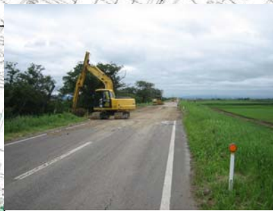
燕市野中才(下流)地先