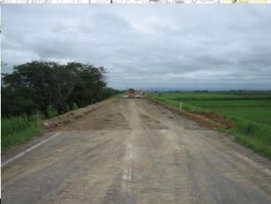
燕市野中才(下流)地先