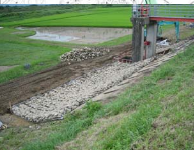
長岡市町軽井地先