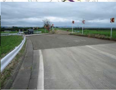
燕市野中才(上流)地先