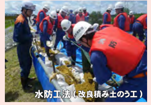
水防工法（改良積み土のう工）

三条市消防団、新潟市消防団、加茂市消防団 見附市消防団、燕市消防団、田上町消防団