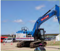
災害対策車両展示

※演習時間中(9:00～11:30)は一部体験コーナーに利用制限が生じます。展示物は予告無く変更する場合があります。