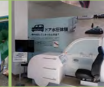
防災学習コーナー