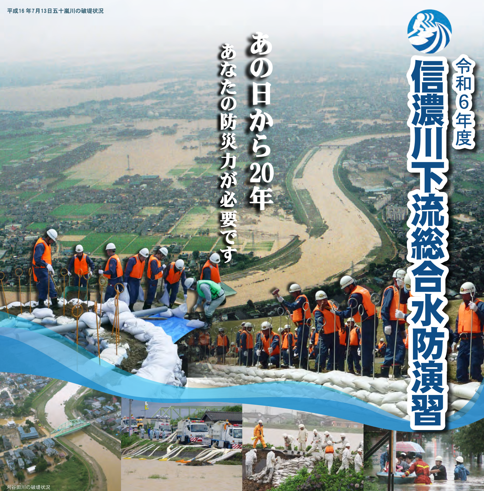
刈谷田川の破堤状況