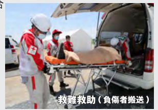
救難救助（負傷者搬送）

東北電力ネットワーク株新潟県電力センター 三条加茂電気工事協同組合、新潟県LPガス協会県央支部 北陸ガス株長岡供給センター三条供給グループ、三条管工事業協同組合