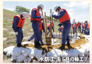
水防工法（月の輪工）

新潟県三条地域振興局地域整備部、三条市 信濃川下流河川事務所 信濃川下流河川事務所