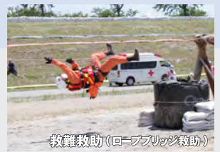
救難救助（ロープブリッジ救助）

三条市、イオンリテール株イオン三条店、NPO 法人コメリ災害対策センター 株アクティオ新潟支店三条加茂営業所