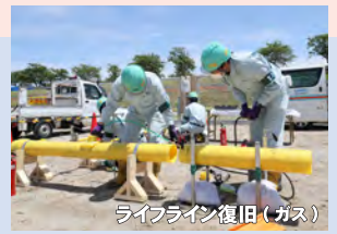
ライフライン復旧（ガス）