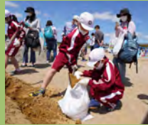
土のう作り・土のう積み体験