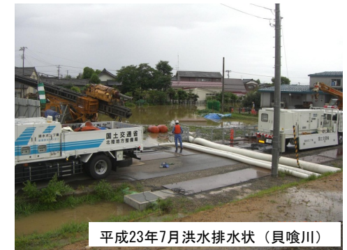
平成23年7月洪水排水状況(具喰川)