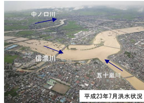
平成23年7月洪水状況