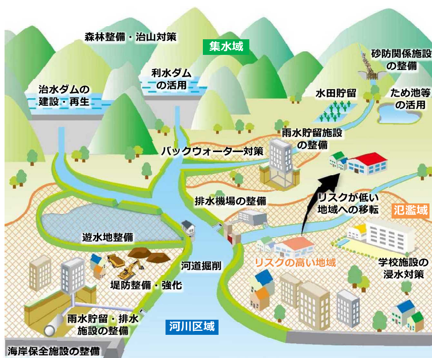
図 52 流域治水のイメージ図

また、氾濫をできるだけ防ぐ・減らすために、流域内の土地利用やため池等の雨水の貯留・遊水機能の状況の変化の把握および治水効果の定量的・定性的な評価など、技術的な支援も含めて関係機関と協力して進め、これらを流域の関係者と共有し、より多くの関係者の参画および効果的な対策の促進に努めるとともに、必要に応じて取組の見直し等も実施します。