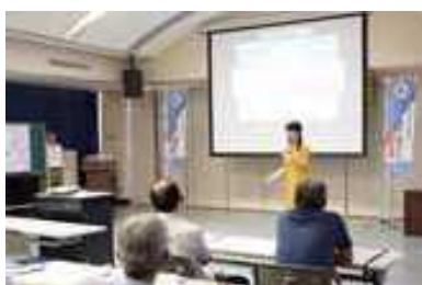
マイ・タイムライン講習会 (信濃川中流)

住民の避難を促すための取組として、水害リスク情報の充実を図り、流域の関係機関と危機感を共有する流域タイムラインの整備と訓練、住民一人一人の防災行動をあらかじめ定めるマイ・タイムラインや地域単位の避難行動計画を定めるコミュニティタイムラインなどの作成への支援を行い、その普及を図っていきます。