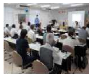
長沼地区コミュニティタイム ライン（長野市長沼地区）