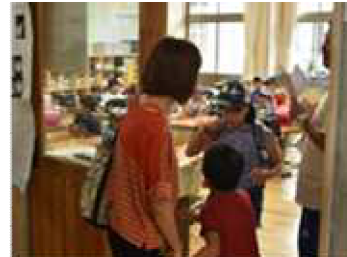
水害を対象とした避難訓練