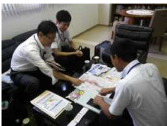
施設管理者へ直接訪問による説明

浸水想定区域内にある要配慮者利用施設や大規模工場等の市町村地域防災計画に記載された施設の所有者又は管理者が、避難確保計画又は浸水防止計画の作成、訓練の実施、自衛水防組織の設置等をする際に、技術的な支援を行い、地域水防力の向上を図ります。