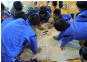
地区防災マップづくり