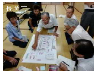
ワークショップの実施