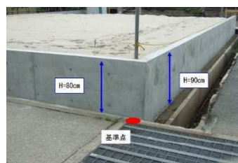
図 54 宅地かさ上げ状況