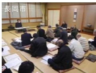
自主防災活動アドバイザー派遣