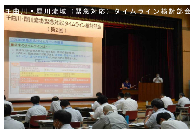
千曲川・犀川流域（緊急対応） タイムライン検討部会