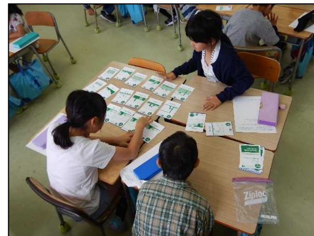
9月21日(土) 防災カードゲーム