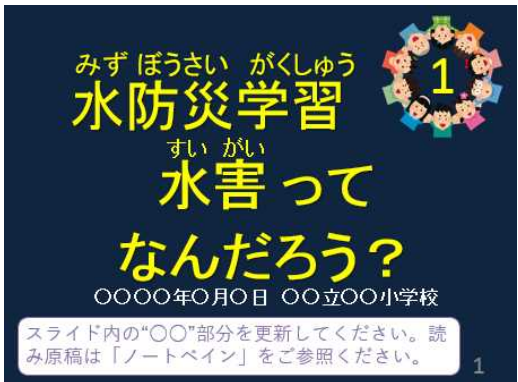
指導計画書(座学スライド表紙)