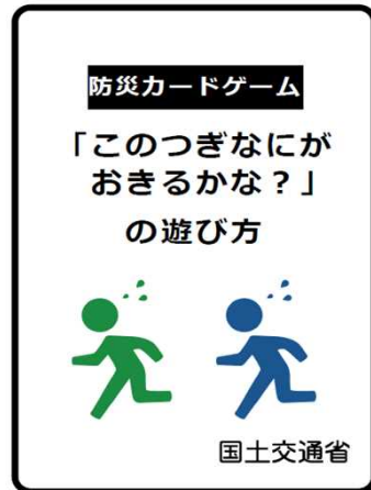
防災カードゲーム(ルール)