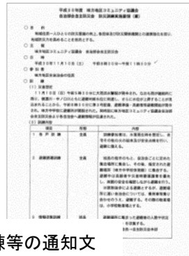
防災訓練等の通知文