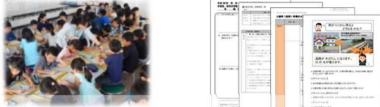
取り組み内容 防災教育資料(案)