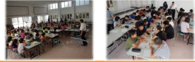
防災学習の取り組み状況(味方小学校H30.9.18・9.19)

学校の要望、地域の実情等に応じて、防災学習会を支援。必要に応じて、関係機関が専門分野の説明等を実施。