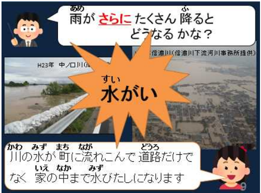
指導計画書(座学スライド例)