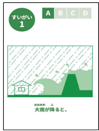
防災カードゲーム