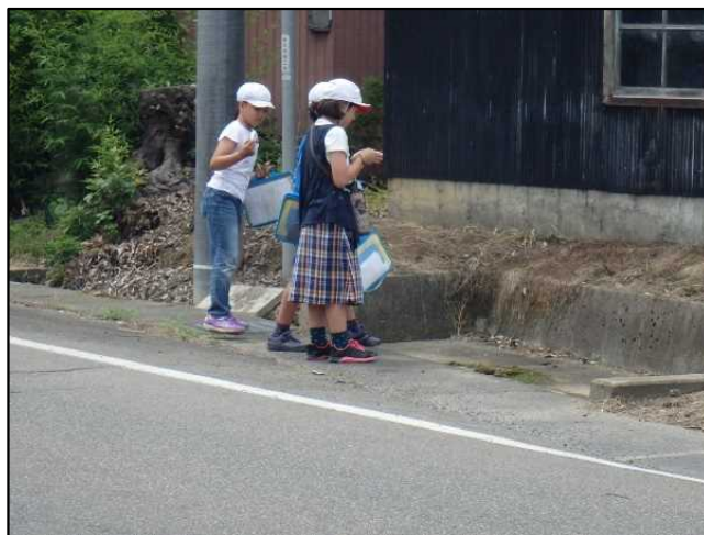
7月5日(金) まちあるき(味方小・中学校)