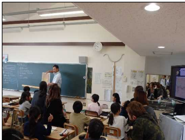
9月21日(土) ハザードマップの見方