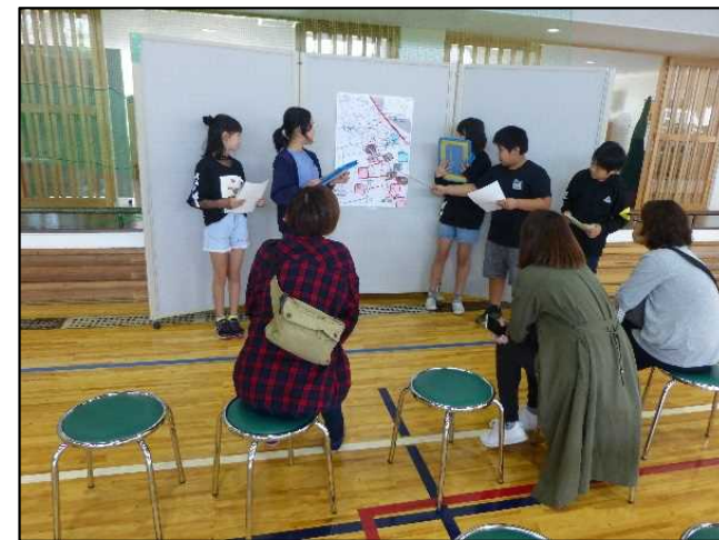
9月21日(土) 水防災安全マップ発表