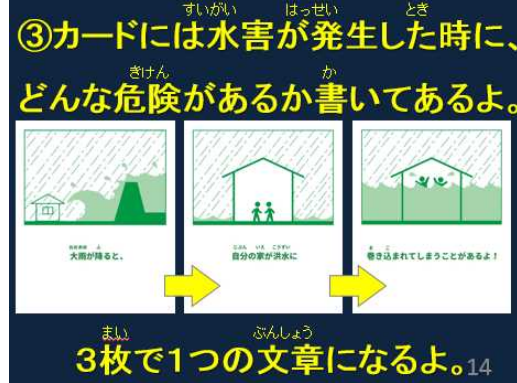
指導計画書(実習スライド例)