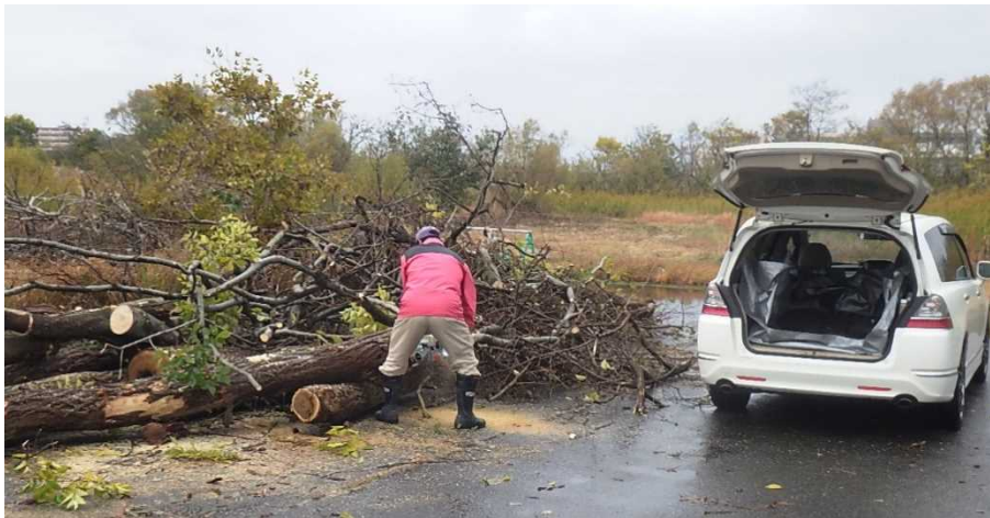
裁断箇所のイメージ (写真は平成28年度の様子)

当事務所が採取の対象となる伐採範囲の樹木を伐採・倒木させ、大型重機で、提供・裁断箇所へ移動しますので、個人で 必要な長さに裁断し お持ち帰り下さい。