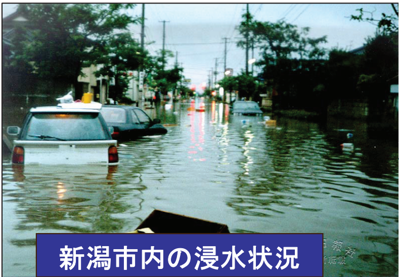
新潟市内の浸水状況