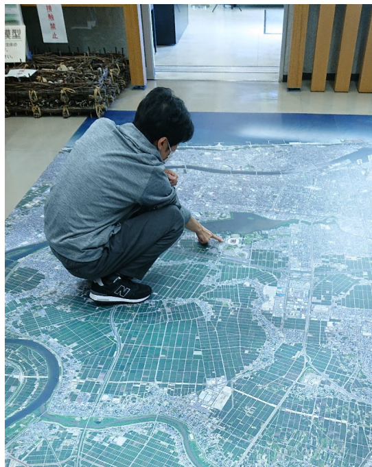
◆ 靴のまま見学してください