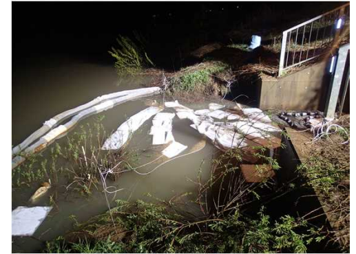
ーオイルフェンス、吸着マット設置状況ー

河川等に流出した油等の回収・処理のための費用は、原因者の負担となりますので、取扱には十分注意してください。