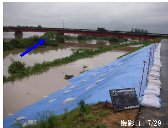
⑩ 田上町下横場地先 右岸25.8kP <シート張>