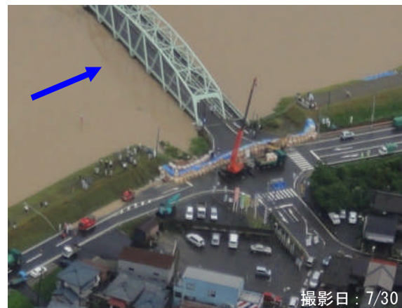
小須戸橋右岸 右岸20.5kP <大型土のう締切>