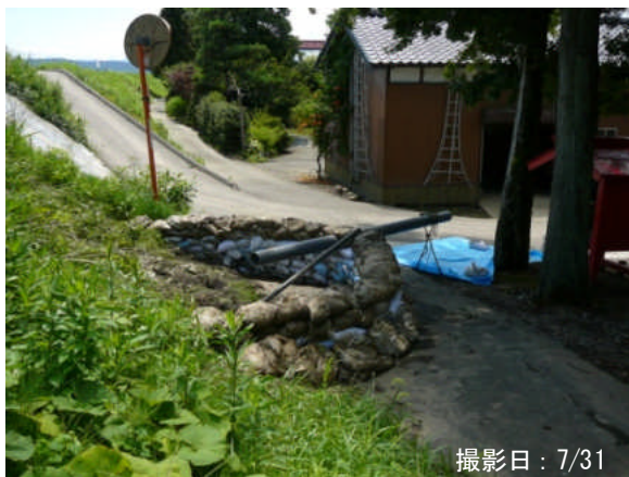
⑫ 三条市井戸場地先 左岸32.5kP <月の輪工>