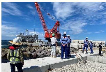
技術力向上（現場見学）