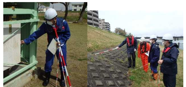
令和5年度の点検状況