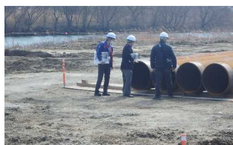
現場見学会に参加