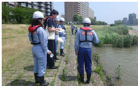
職員と一緒に河川の安全利用点検

○ ホームページ http://www.hrr.mlit.go.jp/shinage/