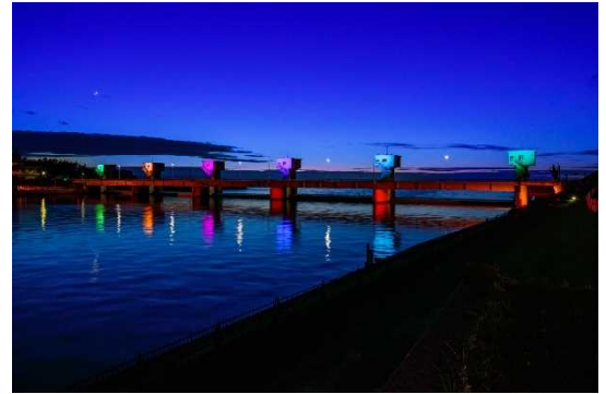
ライトアップされた新潟大堰

横田切れは、1896年(明治29年)7月22日に発生した、信濃川の堤防決壊による洪水です。数日間続いていた大雨により信濃川の水嵩が増大し、新潟県西蒲原郡横田村(現・燕市横田)の堤防をはじめ多くの堤防が決壊しました。これにより新潟市関屋までの広い範囲が浸水しました。