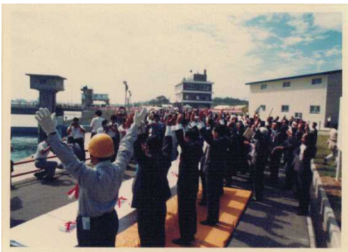
<50年前の式典の様子>